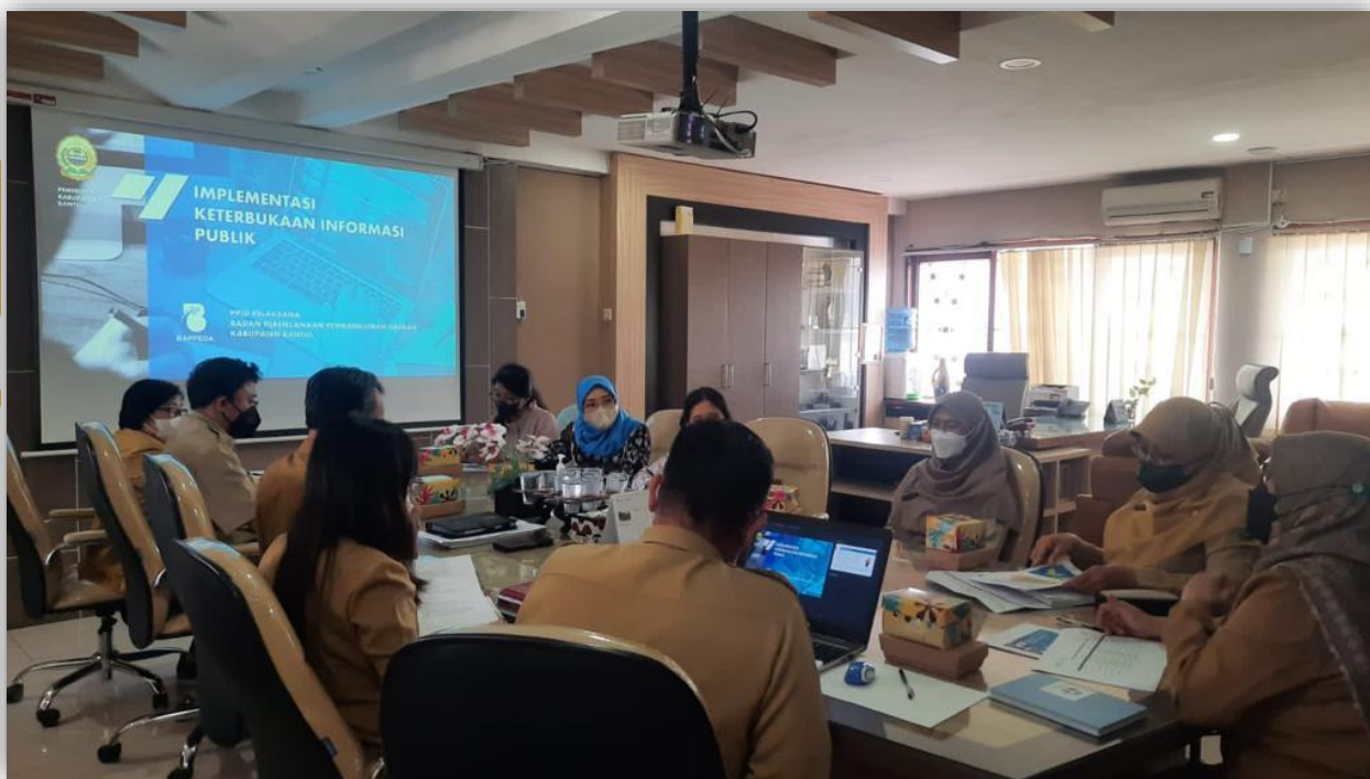
Visitasi Monev Keterbukaan Informasi Tahun 2022