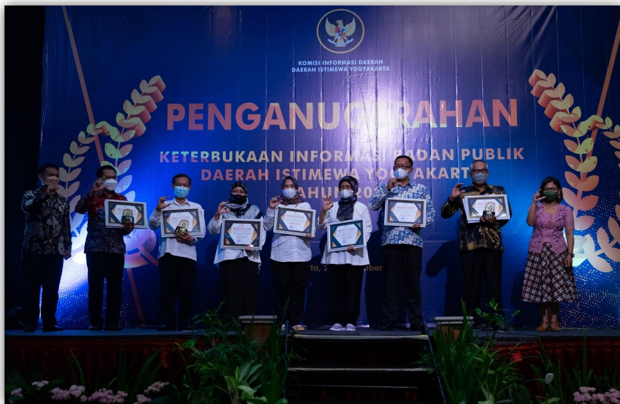
Penganugrahan Keterbukaan Informasi Badan Publik DIY