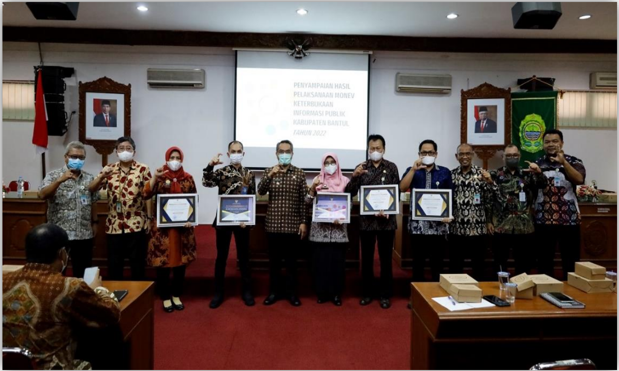
Penganugrahan Keterbukaan Informasi Badan Publik DIY